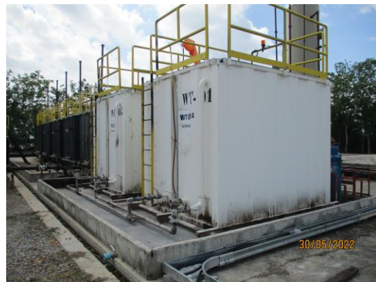
รูปที่ 1-2 ฐานหลุมผลิต L53-B ในระยะผลิตปิโตรเลียม